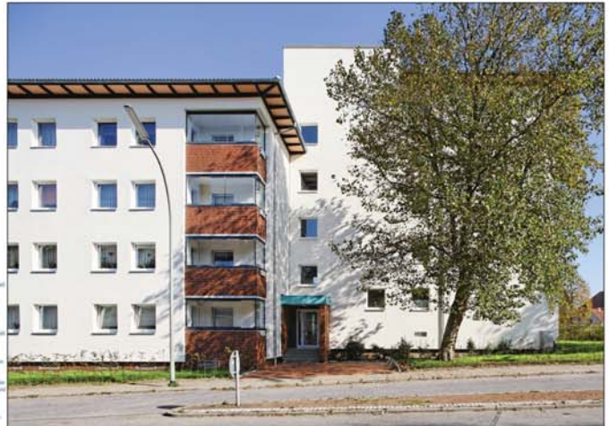
Neue Eingangssituation, Wechsel von Putz- und Verblendsflächen, Ganzglas-Wintergärten, Ringstr. 34