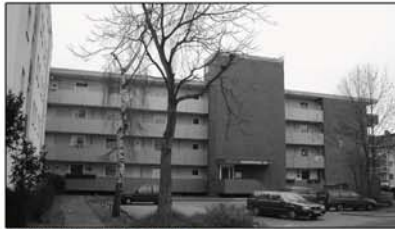
Laubengänge/Eingang alt, Thunstr. 54