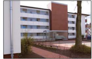
Verglaster Laubengang/ Eingang neu, barrierefrei, Thunstr. 54