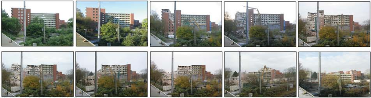
Abbau für den Aufbau, Altenwohngemeinschaft Thunstr. 60